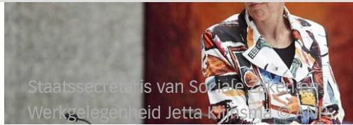
Staatssecretaris van Sociale Zaken en Werkgelegenheid Jetta Klijnsma